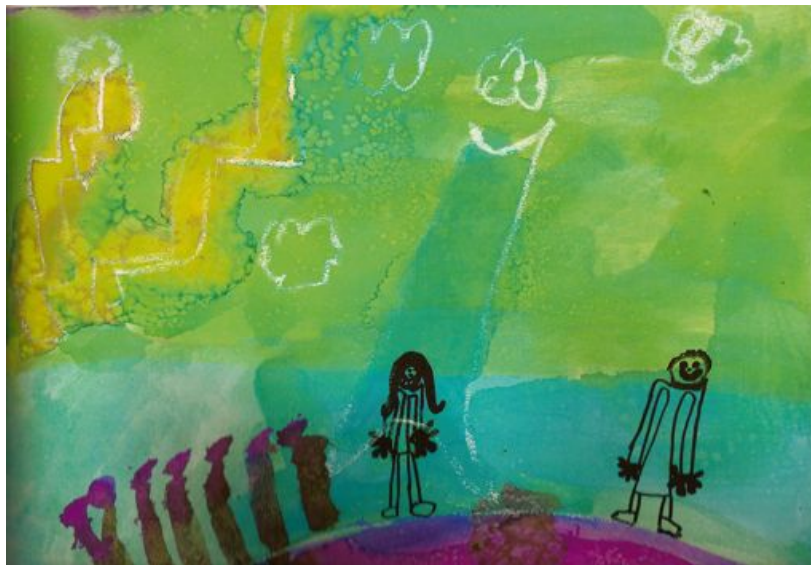
L'histoire de Petit Paul par Théo 2003

Ce travail a donné lieu à une exposition au sein de l'école.